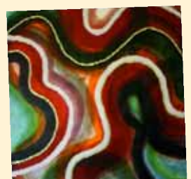
Jac van de Plaats